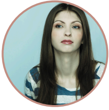
Ellie Bakers GOSSIP GIRL